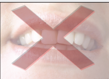
Meinung äußern verboten.

Er darf sich nur noch mit musischen, sportlichen, kulturellen und eingeschränkt mit sozialen Fragen beschäftigen. Zu Themen der Hochschulpolitik, wie beispielsweise der Bachelor/Master-Umstellung, BAföG oder Studiengebühren, darf er sich nicht äußern und kann daher seiner Funktion als Interessenvertretung der Studierenden nicht gerecht werden.