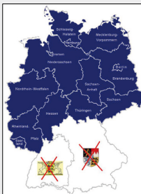
Nur Baden-Württemberg und Bayern haben heute immer noch keine Verfasste Studierendenschaft.

Die damaligen Begründungen für ein Verbot der Verfassten Studierendenschaft entbehren heute mehr denn je jeglicher Grundlage. Andere Bundesländer, in denen die Verfasste Studierendenschaft in den 1970er Jahren ebenfalls abgeschafft wurde, haben sie seit Jahren wieder eingeführt. Inzwischen fordern sogar mehrere Hochschulen in Baden-Württemberg die Wiedereinführung der Verfassten Studierendenschaft.