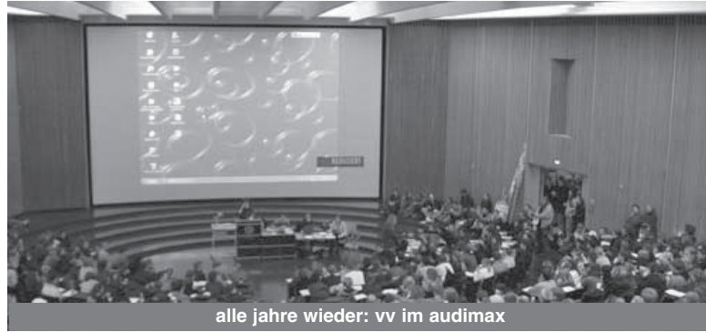
alle jahre wieder: vv im audimax

findet in jedem Semester mindestens einmal statt. Ob es dabei um Semesterticket, Streik oder Protest gegen aktuelle Hochschulpolitik geht – die VV ist praktizierte Basisdemokratie. Genauer Ort und Termin werden rechtzeitig davor bekannt gegeben.