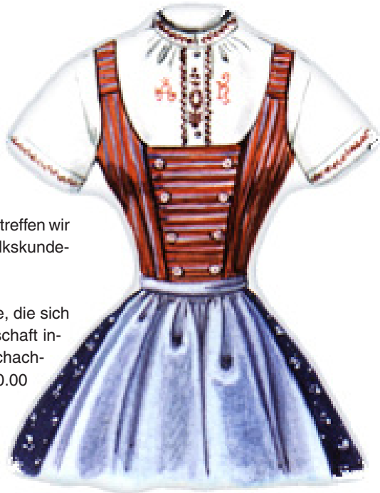
dresscode für die institutsparty

Auf unserer Webseite findet ihr weitere Infos über uns: http://www.fsvolkskunde.tk/